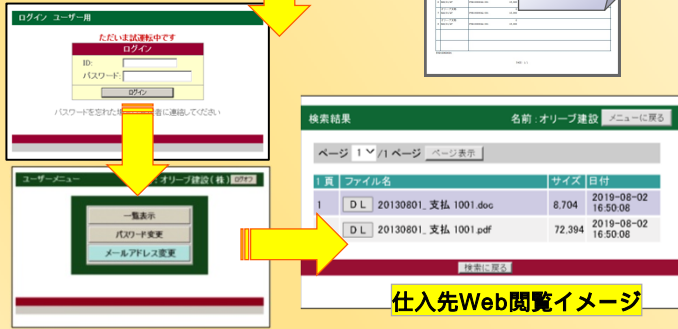
仕入先Web閲覧イメージ